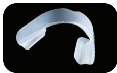
UltraFit Tray vorher