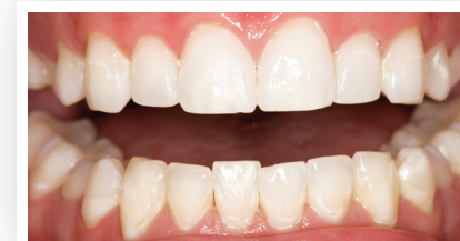
Nach der Zahnaufhellung mit Opalescence Go™