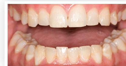
Vor der Zahnaufhellung mit Opalescence Go™