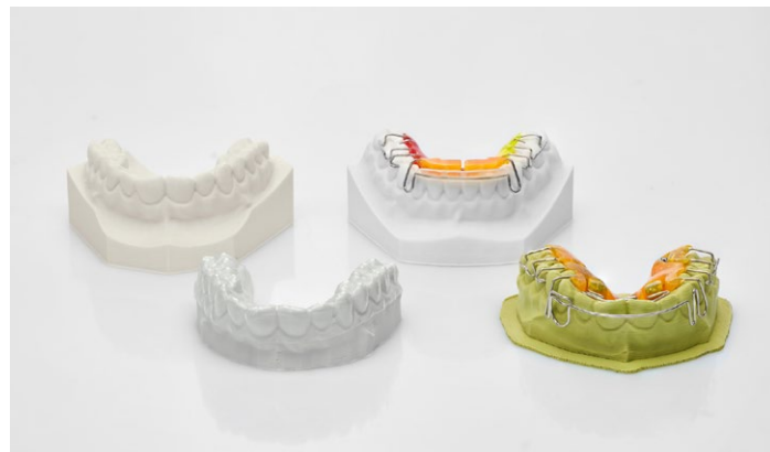
Desenvolvido para toda a confecção de modelos na área de Ortodontia