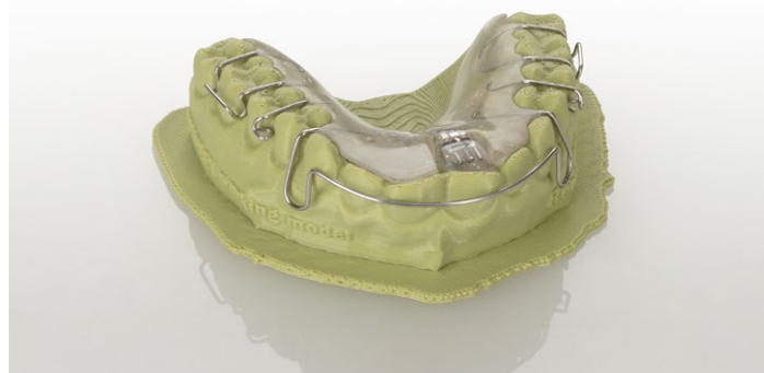
É possível prosseguir o trabalho com o modelo como habitualmente sem nenhum acabamento