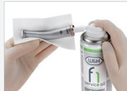
Perfekt für die manuelle Pflege W&H Service Oil F1 in der Spraydose MD-400.

W&H-Dentalantriebe erreichen Spitzendrehzahlen bis zu 390.000 Upm. F1 sorgt für exzellente Schmierung und Innenreinigung und sichert somit die einwandfreie Funktion der Instrumente.