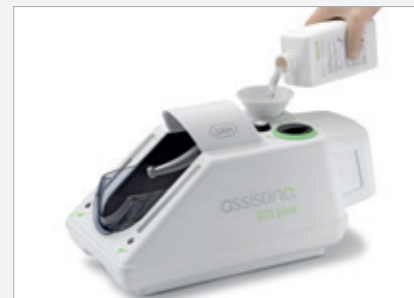
Perfekt in der Assistina W&H Service Oil F1 in der Ölfasche MD-500 für die Anwendung in der Assistina.